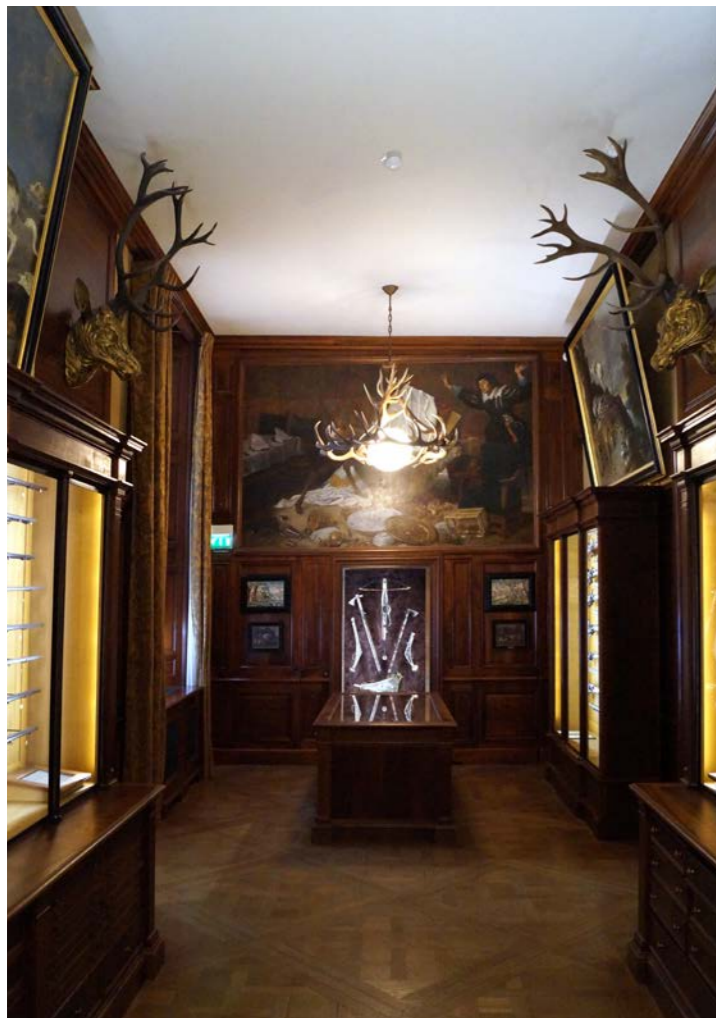
Museet er opbygget på traditionel vis med udstilling, trofæer, jagtvåben og anden 'memorabilia', men lige pludselig finder man noget, der ikke passer ind – f.eks. et moderne kunstværk, der ikke umiddelbart kan associeres med jagt eller en falsk artefakt, der rusker én ud af monotonien.