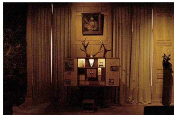
Museet har en række 'cabinet de curiosités', der hver især repræsenterer en vildtart. Hvert kabinet indeholder en række mere eller mindre mærkelige genstande, som associeres med arten. Renæssancelægen Ole Worm ville have følt sig som blommen i et æg i Musée de la Chasse et de la Nature.