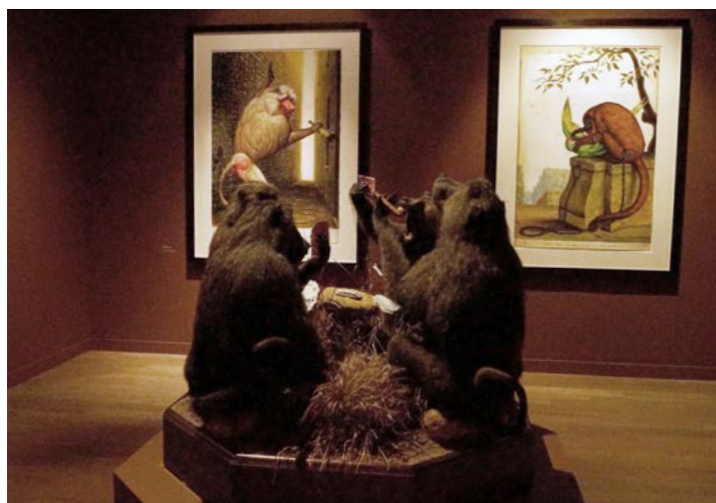
En noget anderledes trofæopsats med fire bavianer, som museet ikke har vidst, hvad det skulle stille op med. Den kommer dog fint til rette blandt Walton Fords skønne serie af abeportrætter.