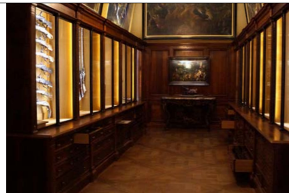
Våbensamlingen er imponerende, og det er åbenlyst, at der er et sammenfald mellem æstetik og overlevned. De folkelige jagtvåben uden udsmykning overlever simpelthen op gennem århundrederne.