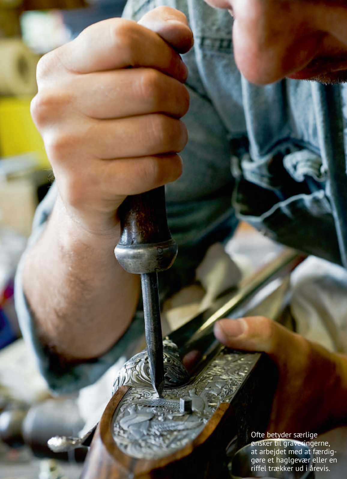
Oftentimes it means special requests for engravings, that the work of finishing a rifle or a rifle receiver takes up to a year.