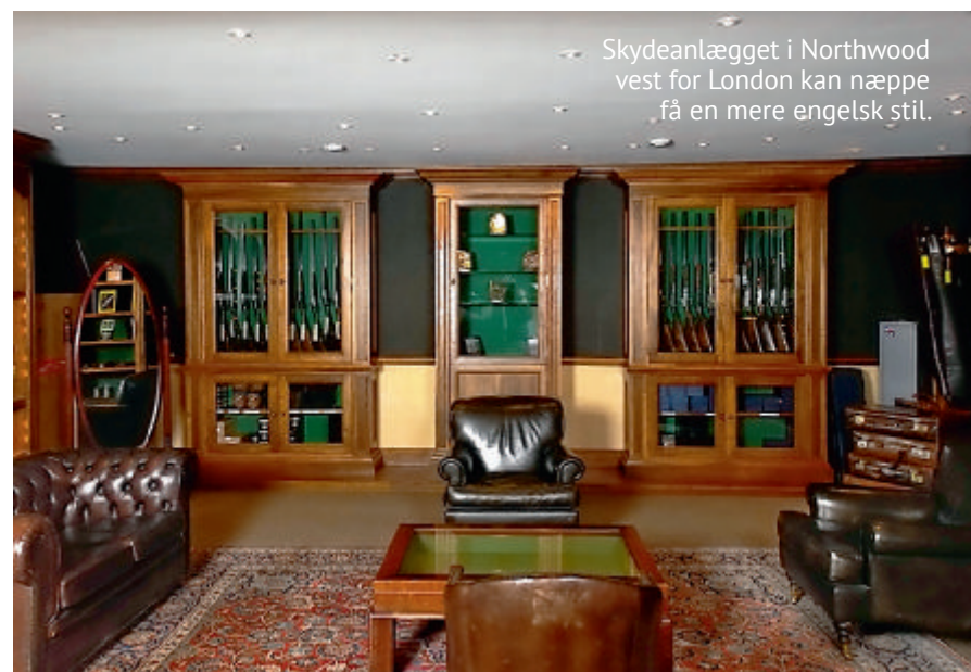
The shooting range in Northwood west of London can hardly get a more English style.